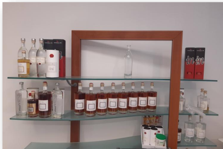
Miglioramento della produzione di distillati