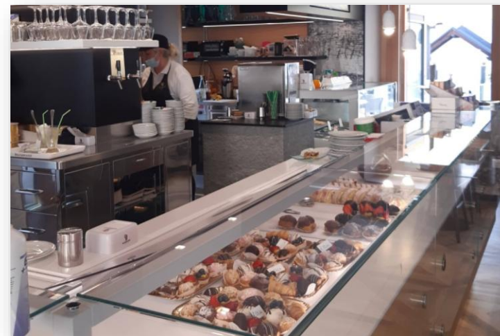
Ampliamento locali pasticceria