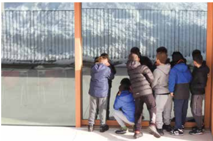
Foto dei bambini che sbirciano dalle vetrate