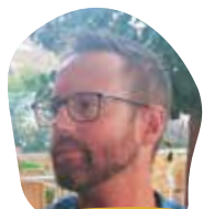
Federico Premi Redattore Voci della Vigolana

«Ogni luogo è un'apertura di mondo»: con queste parole Martin Heidegger, nelle meditazioni di Sentieri interrotti , lega paesaggio ed esistenza, sostenendo che ogni luogo apre, "mette in chiaro", come fosse una radura nel bosco, determinate possibilità di abitarlo. Questo significa che abitare è prendere un habitus , un'abitudine, e quindi con-formare il proprio modo di pensare e sentire a ciò che quotidianamente siamo chiamati a vedere intorno a noi. Pertanto interrogarsi su cosa possa significare « abitare l'Altopiano » può aprirci a qualche riflessione filosofica. Perché l'altopiano – che non è la «mezza montagna» – ha una sua eccezionalità, un suo status ontologico, vale a dire che non si lascia ridurre né alla logica della vetta né a quella della pianura: si configura come una forma intermedia dotata di autonomia propria, in cui l'elevazione si coniuga con l'estensione, e l'orizzonte non è negato dall'altezza, piuttosto è da essa amplificato. Se lo vediamo sotto questo aspetto, un pianoro non è semplicemente un dato morfologico, un paesaggio, ma può essere vissuto come una modalità dell'essere-spazio, un punto di congiunzione tra il salire e lo stendersi, tra la verticalità e l'orizzontalità, che ridefinisce l'usuale visione della montagna come ascesa o discesa . È una