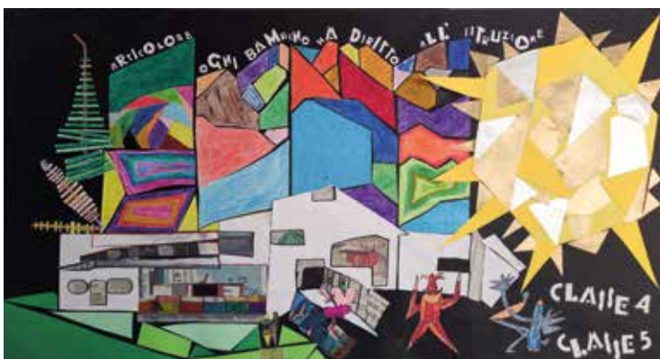
Quadro che rappresenta la nuova scuola di Vattaro in versione futurista. Realizzato dalle classi IV e V.